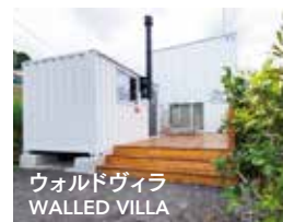
ウォールドヴィラ WALLED VILLA