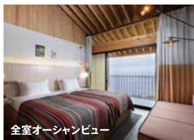
全室オーシャンビュー