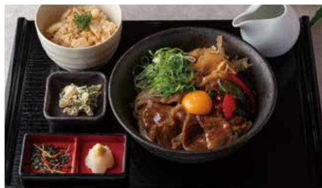
国産黒毛和牛の焼きしゃぶ ぶっかけうどん御膳 2500[税込] Grilled Japanese black beef shabu udon set [うどん+小鉢+ご飯] [Udon + side dish + rice]

国産黒毛和牛を炙り焼きすき焼き風のお出汁をぶっかけてお召し上がりください。黄身を割るとまろやかな味わいに。小鉢・筍と小柱の炊き込みご飯がセットになっています。