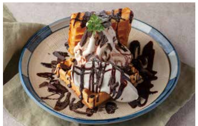
チョコレートワッフル 950[税込] chocolate waffle

たっぷりのレモンと養蜂園の蜂蜜をコトコト煮込んで スッキリまろやかな味わいに仕上げました。 ワッフルと一緒に楽しみください