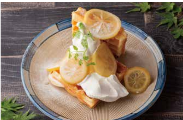
安土養蜂園の蜂蜜レモンワッフル 1100[税込] honey lemon waffle

焼きたてのワッフルにソフトクリームと濃厚抹茶ソースで仕上げました。 抹茶の香りと苦みをお楽しみ下さい。