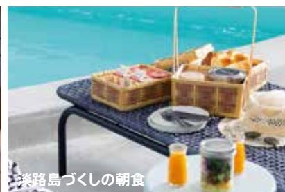
淡路島づくしの朝食