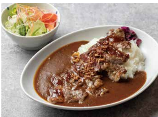
ステーキカレー [サラダ付き] 1700[税込] Steak Curry [With salad]

ガッツリ食べたい方には180gのビーフステーキ。山葵がほんのり香るポン酢であっさりお召し上がりください。