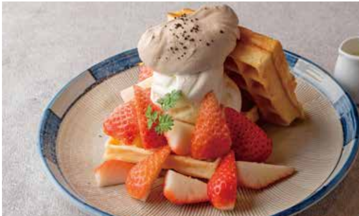
ストロベリーホワイトモカワッフル Strawberry White Mocha Waffle

たくさんの苺とほろ苦いコーヒークリームに 濃厚なホワイトチョコソースをかけて お召し上がりいただく贅沢なワッフル