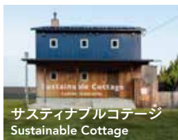
サスティナブルコテージ Sustainable Cottage

家族でゆっくりとおくつろぎいただける 一棟貸しのコテージ。 詳しくはWEBをご参照ください。