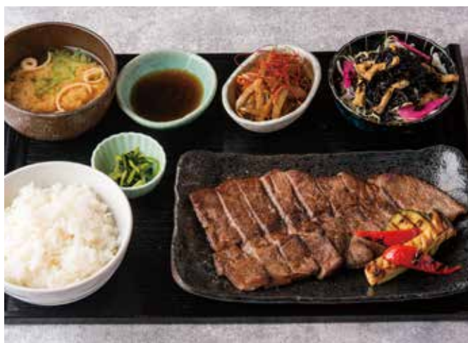
ビーフステーキ御膳 2600[税込] Beef Steak Set [サラダ+ご飯+お味噌汁] [Salad + rice + miso soup]

国産黒毛和牛を炙り焼きすき焼き風のお出汁をぶっかけてお召し上がりください。黄身を割るとまろやかな味わいに。小鉢・筍と小柱の炊き込みご飯がセットになっています。