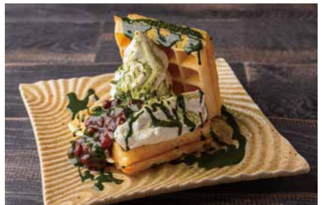
濃厚抹茶ワッフル 1200[税込] Rich matcha waffle

きんかんの爽やかな香りと甘みを感じられるソースと、柔らかいほうじ茶のクリームを合わせ、春らしい色鮮やかな桜の餡を添えた和風の春限定ワッフル